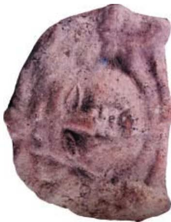
Із втрачених джерел культурної спадщини України. Теракотові маски. Теракота відтиснута в формі. I—II ст. по Р. Х. Північне Причорномор'я, Римський час. (з колекції «Платар»).