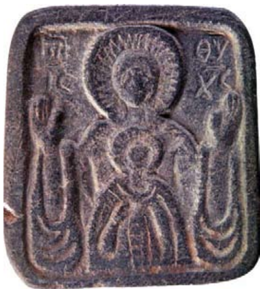
Із втрачених джерел культурної спадщини України. Іконка із зображенням Божої Матері Знамення. Піщано-глинистий сланець. Різьблення. Розміри 5,9 × 5,5 × (0,5–0,8) см. XII–XIV ст. Південна Русь (з колекції «Платар»).

Ця співпраця має будуватися на чіткому розподілі функцій. Державна служба з питань національної культурної спадщини приймає на себе функції, пов'язані з фінансовим забезпеченням процесу виявлення, державним обліком, охороною археологічної спадщини. НАН України в особі Інституту археології координує діяльність вчених із