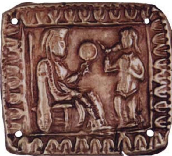
Із втрачених джерел культурної спадщини України. Пластина із зображенням сцени «посвячення» («адорації»). Золото, штампування. Розміри 4,5 × 2,8 см. 330—300 рр. до Р. Х. (скіфи) (з колекції «Плагар»).

Тут сконцентровано 90 % висококваліфікованих вчених-археологів — докторів та кандидатів наук, серед яких кілька десятків лауреатів державних премій України, членів академій різних країн Європи. Інститут веде велику роботу з підготовки наукових кадрів країни у вищих навчальних закладах і через аспірантуру, координує археологічні дослідження, стежить за їх науковим рівнем, розробляє методіку і